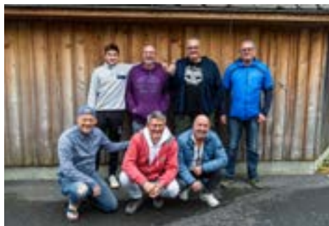
2. Die Toten Badehosen