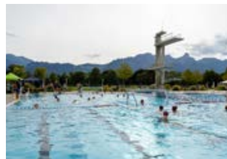
3. Scottish Rugby (leider kein Foto)