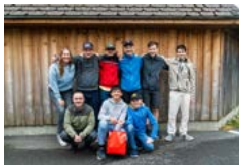
3. The TPC