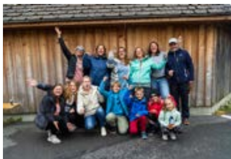
3. Chicken Tschiberlis