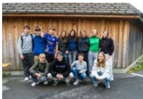
5. Turbiene Mayas