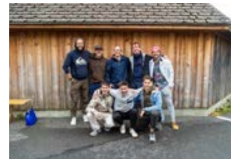
2. Uni Bern