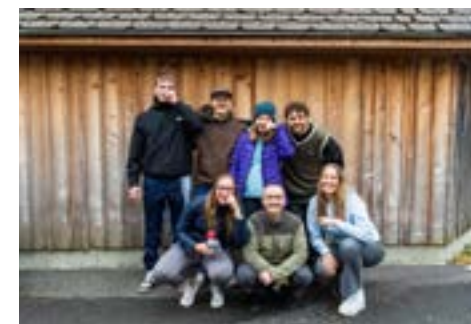
4. Schwader Schnöiz